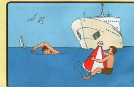
НЕ ПОДПЛЫВАЙТЕ К ПРОХОДЯЩИМ СУДАМ! НЕ ВЗБИРАЙТЕСЬ НА ТЕХНИЧЕСКИЕ ПРЕДУПРЕДИТЕЛЬНЫЕ ЗНАКИ!