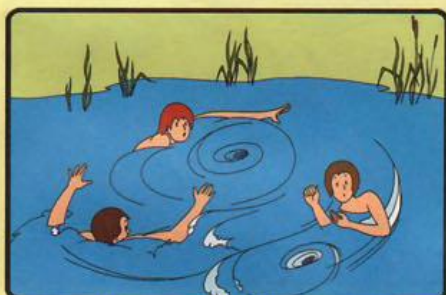
НЕ БОРИТЕСЬ С СИЛЬНЫМ ТЕЧЕНИЕМ! ПЛЫВИТЕ ПО ТЕЧЕНИЮ, ПОСТЕПЕННО ПРИБЛИЖАЯСЬ К БЕРЕГУ!