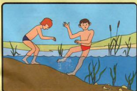
НАХОДЯСЬ В ВОДЕ, ИЗБЕГАЙТЕ НАСТУПАТЬ НА ИЛИСТОЕ И ЗАРОСШЕЕ ВОДОРОСЛЯМИ ДНО!