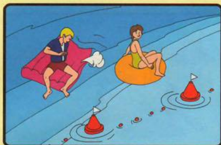
НЕ ЗАПЛЫВАЙТЕ ДАЛЕКО ОТ БЕРЕГА НА НАДУВНЫХ МАТРАСАХ И АВТОМОБИЛЬНЫХ КАМЕРАХ!