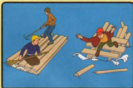
НЕ ИСПОЛЬЗУЙТЕ ДЛЯ ПЛАВАНИЯ САМОДЕЛЬНЫЕ УСТРОЙСТВА! ОНИ МОГУТ НЕ ВЫДЕРЖАТЬ ВАШ ВЕС И ПЕРЕВЕРНУТЬСЯ!