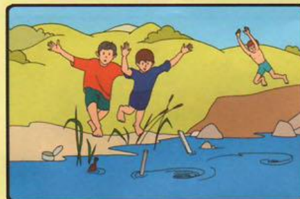
НЕ КУПАЙТЕСЬ У КРУТЫХ ОБРЫВИСТЫХ БЕРЕГОВ С СИЛЬНЫМ ТЕЧЕНИЕМ, В ЗАБОЛОЧЕННЫХ И ЗАРОСШИХ РАСТИТЕЛЬНОСТЬЮ МЕСТАХ!