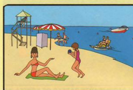
КУПАЙТЕСЬ ТОЛЬКО В РАЗРЕШЕННЫХ МЕСТАХ, НА БЛАГОУСТРОЕННЫХ ПЛЯЖАХ!