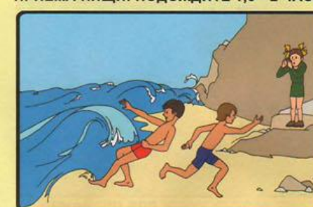
НЕ КУПАЙТЕСЬ В ШТОРМОВУЮ ПОГОДУ! БЕРЕГИТЕСЬ ВОЛНЫ!