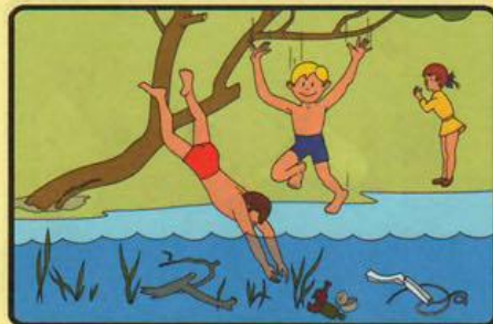
НЕ НЫРЯЙТЕ В НЕЗНАКОМЫХ МЕСТАХ! ПОД ВОДОЙ МОЖЕТ ОКАЗАТЬСЯ КАМЕНЬ, КОРЯГА, СТЕКЛО.