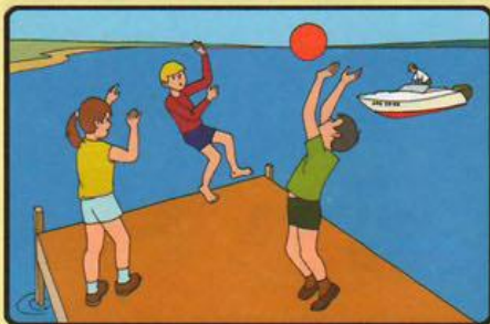
НЕ СТОЙТЕ И НЕ ИГРАЙТЕ В ТЕХ МЕСТАХ, ОТКУДА МОЖНО УПАСТЬ В ВОДУ!