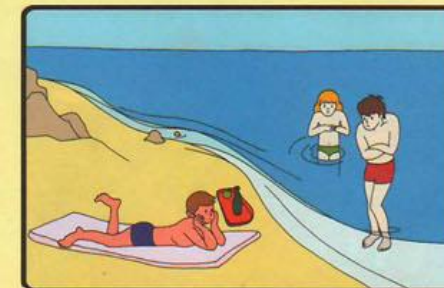
НЕ ПЕРЕОХЛАЖДАЙТЕСЬ! НЕ КУПАЙТЕСЬ ПРИ ТЕМПЕРАТУРЕ ВОДЫ НИЖЕ 18°C И ВОЗДУХА НИЖЕ 20°C! НЕ КУПАЙТЕСЬ СРАЗУ ПОСЛЕ ПРИЕМА ПИЩИ: ПОДОЖДИТЕ 1,5 - 2 ЧАСА!