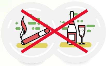
ОТКАЗ ОТ ТАБАКА И АЛКОГОЛЯ