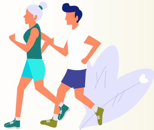
ДОСТАТОЧНАЯ ФИЗИЧЕСКАЯ АКТИВНОСТЬ